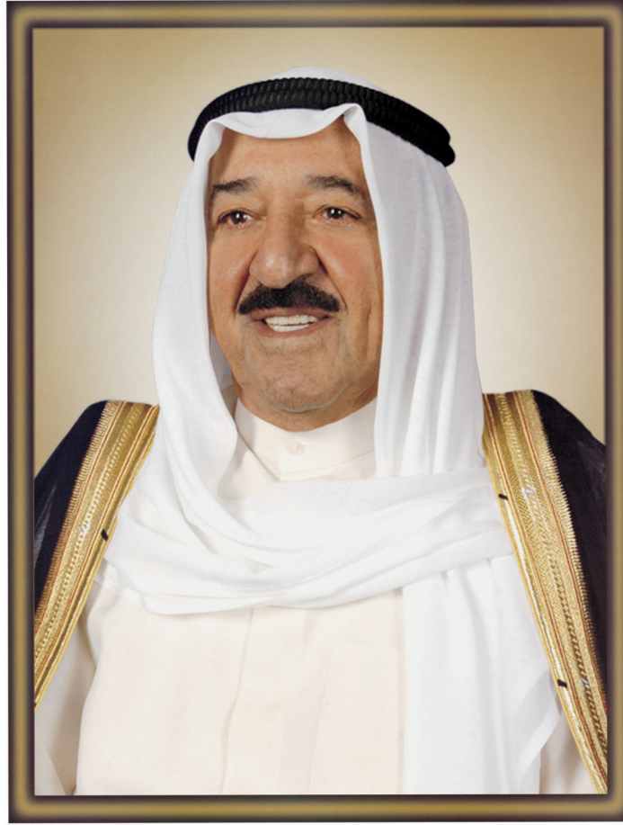
صاحب السمو الشيخ صباح الأحمد الجابر الصباح أمير دولة الكويت