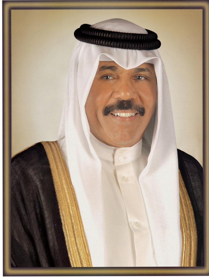
سَيِّدُ الشَّيْخِ نَوَافِلُ بْنُ عَبْدِ اللَّهِ بْنِ السَّبَّاحِ وَلِيَّ عَهْدِ دَوْلَةِ الْكُوَيْتِ